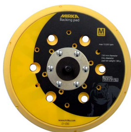
Plato para Malla 150mm 5/16" Grip 48Ag. Medio 8292605011

La lijadora Mirka® DEROS tiene su propio plato.