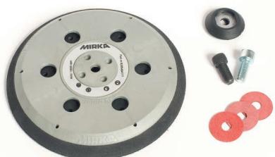
Plato UNI 150mm 5/16"+ M8 Grip 61Ag. Medio 8295494111

Mirka dispone de un plato universal para todas las máquinas: el plato Unipad (excepto para DEROS y CEROS).